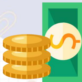
财务金融理论与实务分析