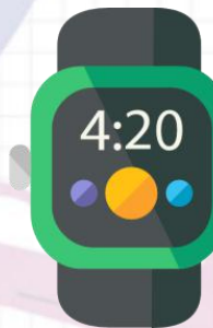
穿戴装置应用创客营