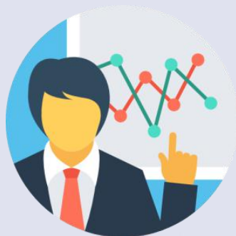
经营管理与产业分析